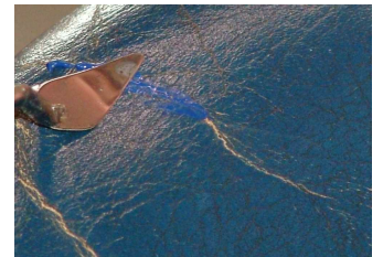
... und gleichmäßig verteilen