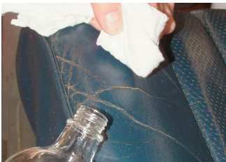
Mit Reinigungsbenzin entfetten

Da die empfohlenen Produkte nur bei richtiger Reihenfolge und Anwendung zu einem schönen Ergebnis führen, finden Sie im folgenden Text eine detaillierte Anleitung, um die typischen Verunreinigungen und Verschleißspuren bei Fahrzeugledern mit unseren Produkten bestmöglich zu reinigen, zu reparieren und zu pflegen.