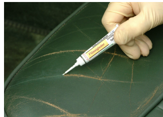
Mit Flüssigleder auffüllen...