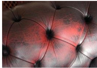
Abgeriebene Patina im Kopfbereich