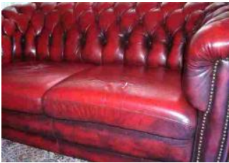
Typische Patina bei Chesterfield-Ledern

Antikleder, bei denen schon ein Farbabrieb aufgetreten ist, sollten mit unserer Leder Versiegelung gepflegt werden. Die Leder Versiegelung fixiert die Oberfläche und reduziert weiteren Farbabrieb. Anschließend sollte das Leder bei seidenmatten Ledern mit unserem Leder Protector und bei glänzenden Ledern mit unserem Elephant Lederfett neu gepflegt werden. Dadurch bleibt das Leder geschmeidig und schön. Die professionelle Aufarbeitung Ihrer Lederpolster kann aber auch von Fachbetrieben durchgeführt werden. Wir empfehlen Ihnen gerne Ihren nächsten Fachbetrieb.