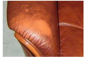
Patinierung mit Brauntön, Auffrischung nur mit Sonderfarbe möglich