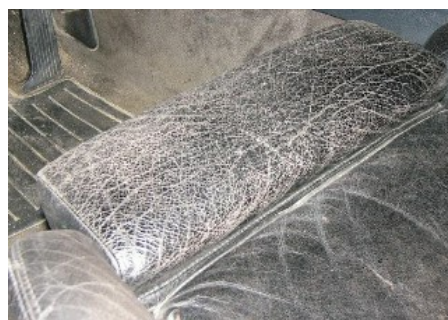
Stark brüchige Autoleder.