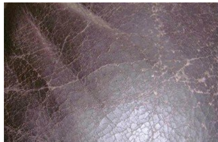
Ältere und stark brüchige Möbelleder.