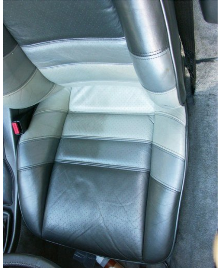
Leder mit einem Metallceffekt bei Porsche