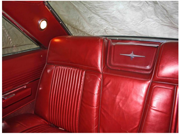
US-Fahrzeuge haben häufig Metallic-Effekte.

LEDERZENTRUM GmbH Raiffeisenstraße 1, 37124 Rosdorf bei Göttingen Tel. (49) 551 770 730 • e-mail info@lederzentrum.de • Web www.lederzentrum.de