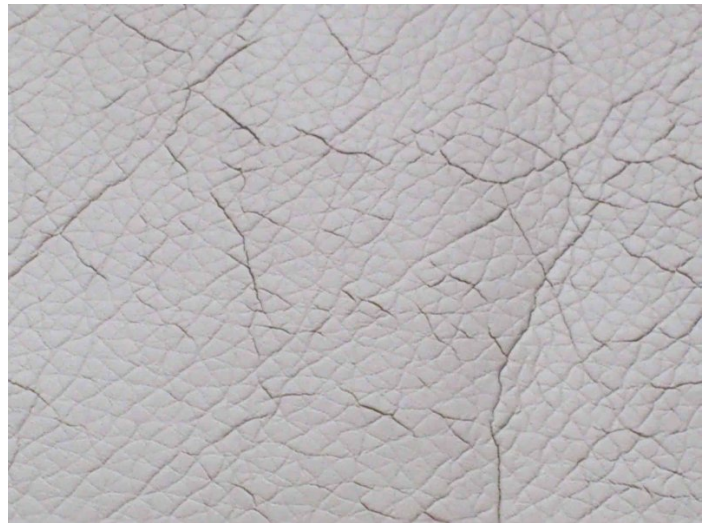
Brüche durchziehen den Belastungsbereich. Keine Reparatur möglich.