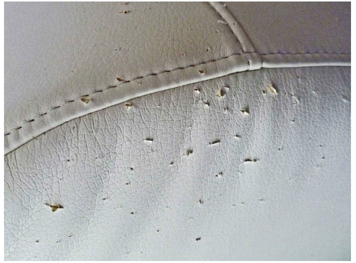
Katzenkratzer: Mühseliges Herunterkleben der abstehenden Fasern ist die Notlösung.

LEDERZENTRUM GmbH Raiffeisenstraße 1, 37124 Rosdorf bei Göttingen Tel. (49) 551 770 730 • e-mail info@lederzentrum.de • Web www.lederzentrum.de