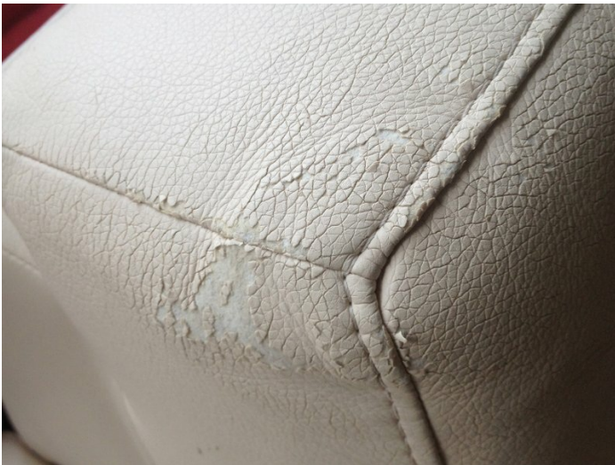
Die Oberfläche platzt nach und nach ab. Keine Reparatur möglich.

Ältere Kunstleder konservieren Sie mit unserem COLOURLOCK Kunstleder Protector . Dieses Produkt schützt Oberflächen vor Abriebspuren und Verschmutzungen. Der Kunstleder Protector ändert nicht den Glanzgrad und macht die Oberfläche nicht "speckig". Den Kunstleder Protector auf einen fusselfreien Lappen sparsam auftragen und die Oberfläche gleichmäßig behandeln.