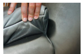
zu großes Loch